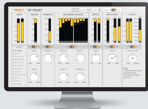
Interface de traitement de son