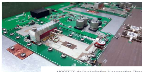
MOSFETS de 6 e génération & conception Planar