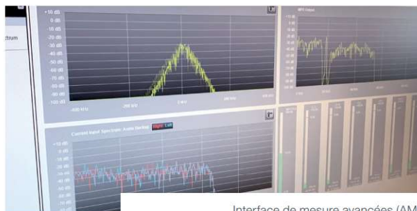
Interface de mesure avancées (AMI)