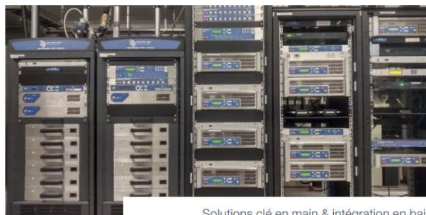
Solutions clé en main & intégration en baie