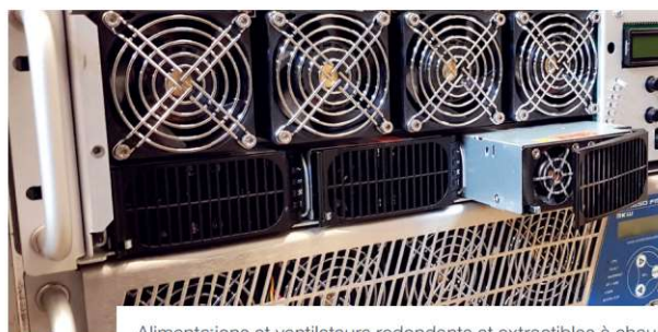
Alimentations et ventilateurs redondants et extractibles à chaud